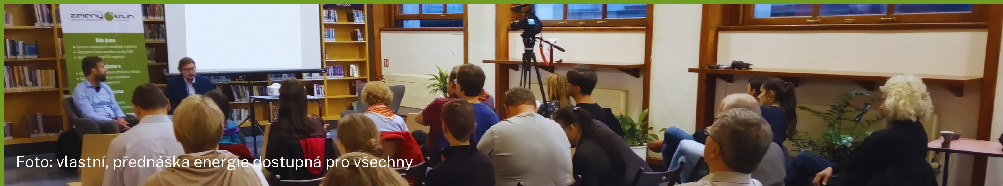
přednáška energie dostupná pro všechny